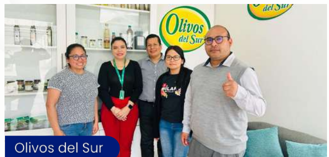
Olivos del Sur