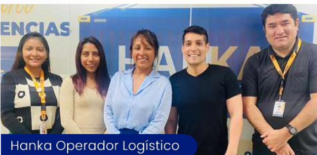
Hanka Operador Logístico