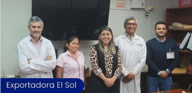
Exportadora El Sol